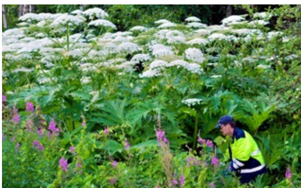
Kuvassa jättiputkien kitkentää, kuva Kouvolan kaupunki.

Vieraslajien oikeaoppinen hävittäminen on tärkeää, jotta siemenet ja muut lisääntyvät osat eivät pääse leviämään ympäristöön. Esimerkiksi jättiputkien varret ja lehdet voi kompostoida tai tuoda jäteasemille tavallisena puutarhajätteenä, niistä laji ei pääse leviämään. Kukinnot ja juuret hävitetään vieraslajijätteenä, jotta leviäminen estetään.