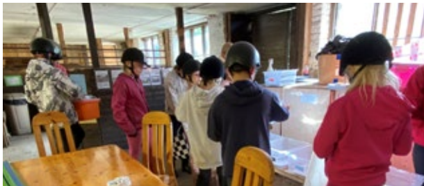
Järjestimme neuvontatilaisuuden hevosharrastajille syyskuussa Hempyölin tallilla Pyhtäällä.

Kysy lisää ja tilaa koulutus neuvonta@kymenlaaksonjate.fi tai puh. 05 744 3473. ◆