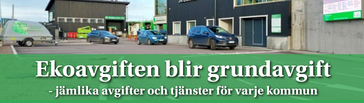
bid: Jumalniemi avfallsstation

Visste du att över hälften av eko- och grundavgifterna används för avfallsstationernas kostnader?