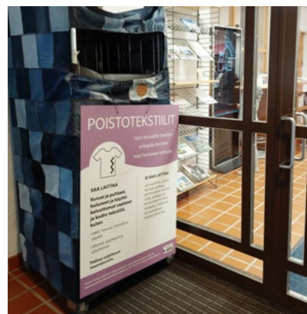
Avlagda textilier tas bl.a. emot på Pyttis bibliotek.

Avlagda textilier ska packas i en sluten plastpåse eller sopsäck så att det återvunna materialet inte blir fuktskadat. ♦